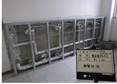
公衆トイレ改修工事