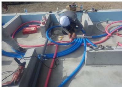
新築住宅 給水・給湯配管工事