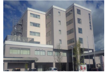
総合病院 配管工事